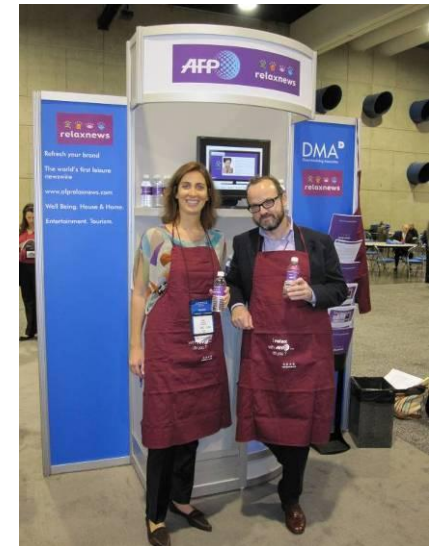
Le stand de Relaxnews lors de l'édition 2009 à San Diego