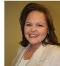
Suzanne Vranica Advertising Columnist, The Wall Street Journal