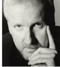
James Cameron Producer/Director, Avatar