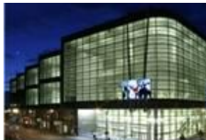
Le Moscone Center, le plus grand centre de convention de San Francisco, accueillera la DMA en octobre prochain.