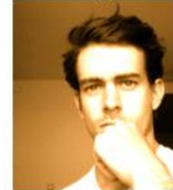
Jack Dorsey Co-Founder, Twitter