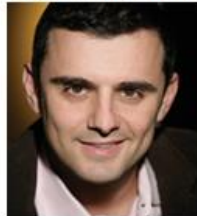
Gary Vaynerchuk Author of NYT best seller, CRUSH IT